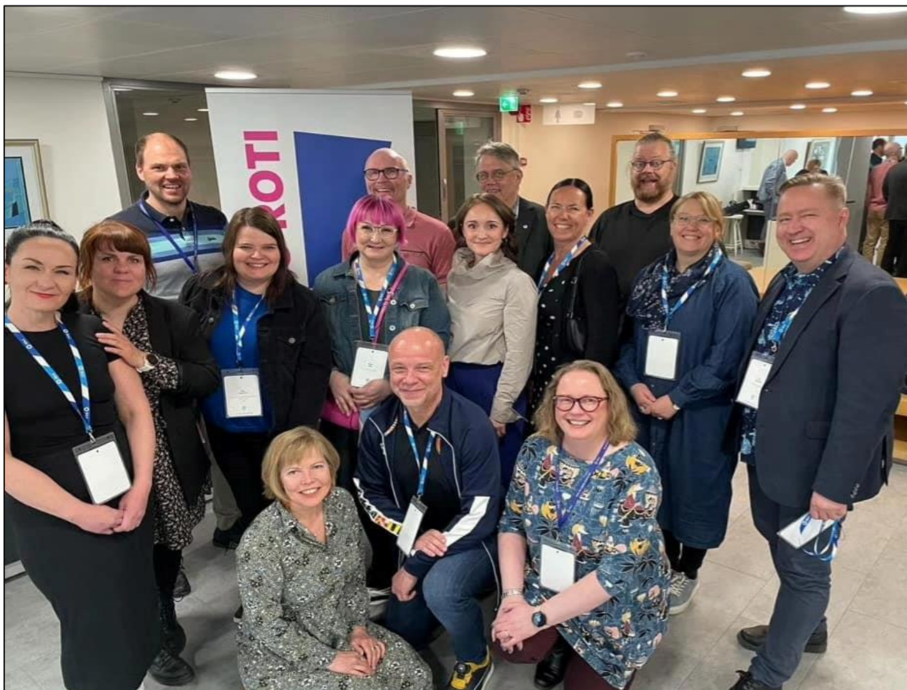
Kuvassa pirkanmaalaisia OAJ-valtuutettuja.