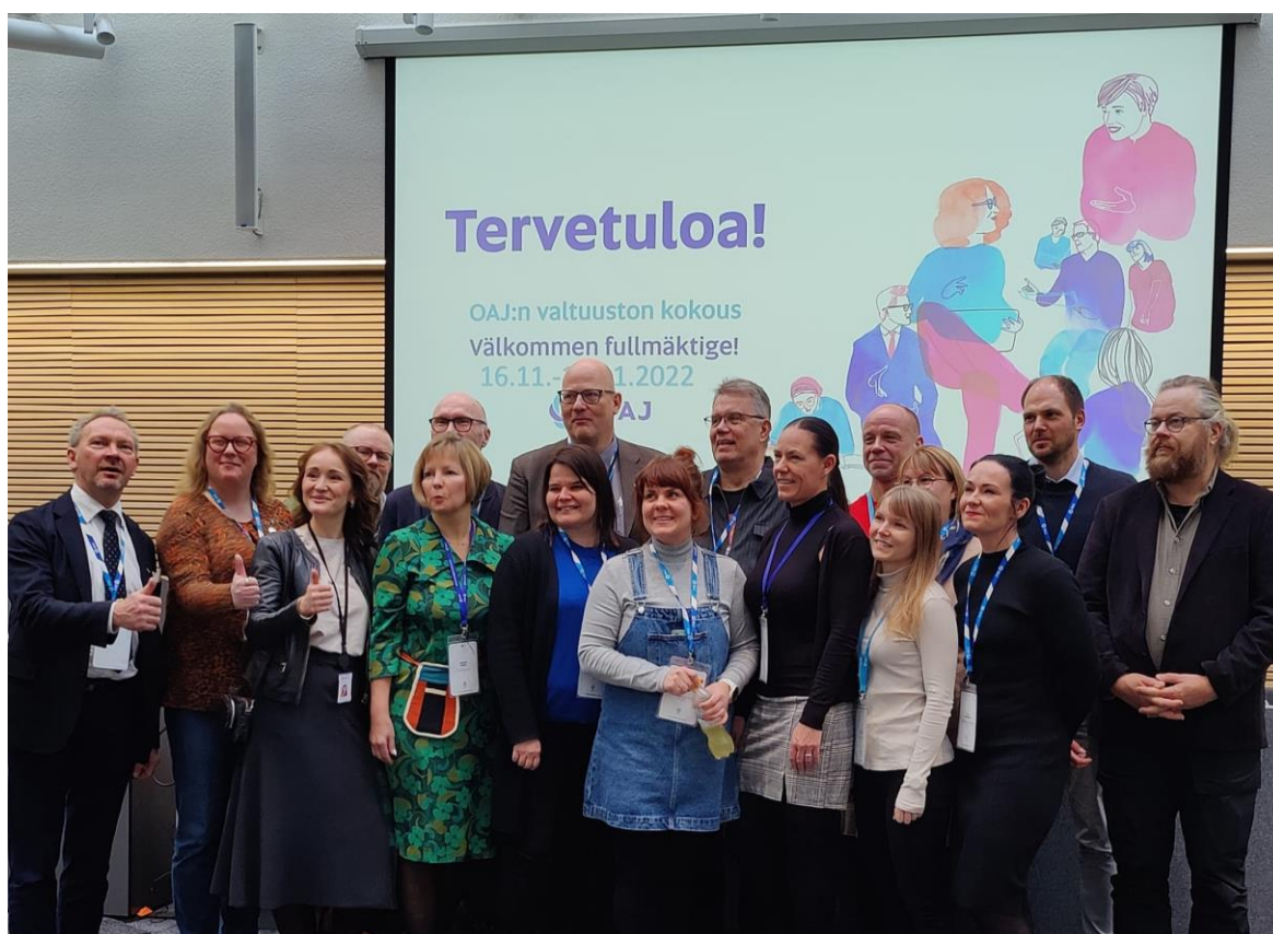
Kuvassa pirkanmaalaisia OAJ:n valtuutettuja

OAJ:n valtuuston tämän syksyn kokous pidettiin 16.-18.11 Pasilassa. Asialistalla oli runsaasti asioita opettajien ja esihenkilöiden asemasta laidasta laitaan. Kokouksessa herätti paljon keskustelua opettajaksi opiskelevien asema. Heidän edustajansa osallistuvat valtuuston kokouksiin, ja käyttävät myös puheenvuoroja. Heillä ei kuitenkaan ole äänioikeutta siellä. Tämän syksyn kokouksessa näytti vahvasti siltä, että opiskelijajäsenten äänioikeuden saaminen näyttää etenevän. Ponsiesitysten kautta tätä päätettiin valmistella kevään valtuuston kokoukseen. Itse kannatin vahvasti tätä äänioikeutta, koska he ovat tulevia jäseniämme ja rikastuttavat muutenkin näkökulmia, joita kokouksessa esitetään.