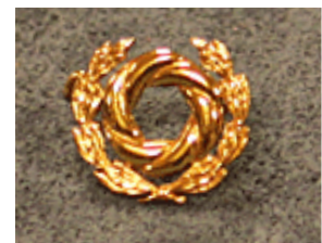
OAJ:n kultainen ansiomerkki

Ansiomerkkien jakoperusteena käytetään pisteytystä eri tasojen tehtävien mukaan. Hakumenettely on jatkuvaa ja tätä varten OAJ-Areenasta löytyy ansiomerkkin ehdotus- ja pisteytyslomake.