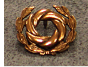
OAJ:n pronssinen ansiomerkki

On tärkeää, että myös kentällä ollaan aktiivisia näissä merkkiasioissa. Yrityksestämme huolimatta emme aina saa tietoomme mahdollisia palkittavia. Toimikunta ei ole pahoillaan, vaikka saisimmekin vinkkiä tähän suuntaan.